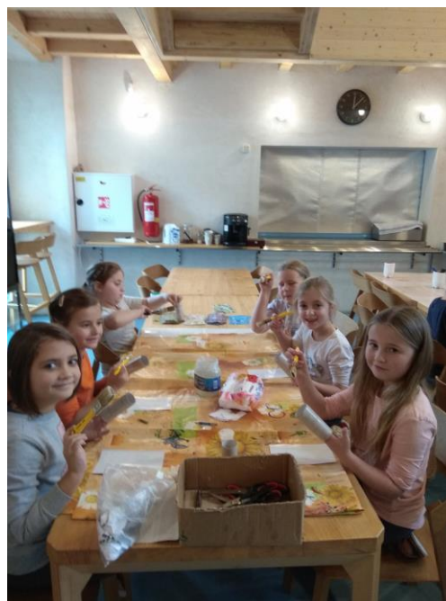
Fotografie z projektu „Třídím pro Horaždovicko“

Kancelář: Mayerova 1067, 34101 Horažďovice www.dsohohorazdovicko.cz Kontakt: manažer CSS tel.: 606910913, horazdovicko@seznam.cz ; specialista pro rozvoj mikroregionu: tel.: 606910913, mail: horazdovickocss@seznam.cz ,