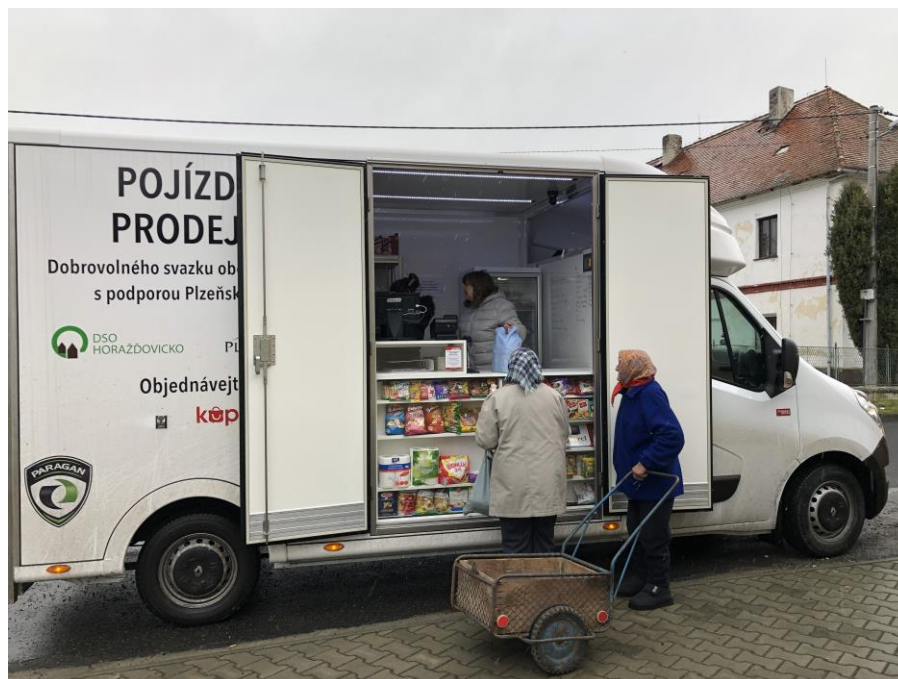
Fotografie pojízdné prodejny dobrovolného svazku obcí Horaždovicko